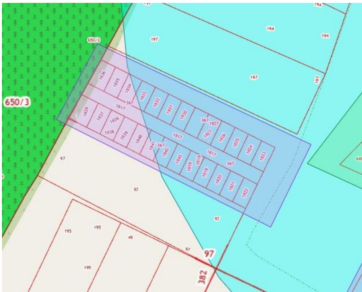
Схема границ территории, в отношении которой принято решение о подготовке документации по планировке территории