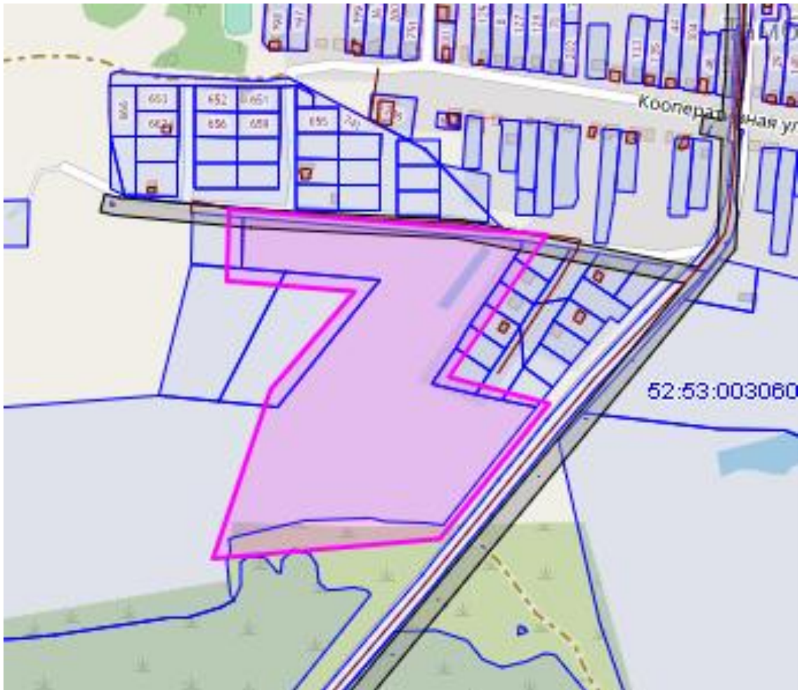
Схема границ подготовки документации по планировке территории