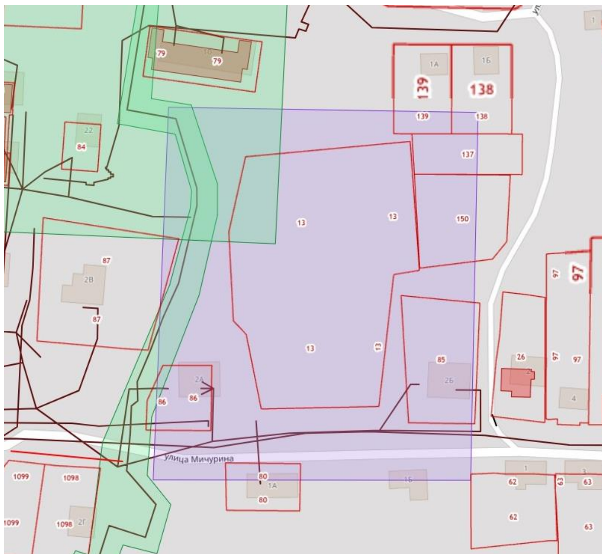
Схема границ территории, в отношении которой принято решение о подготовке документации по планировке территории