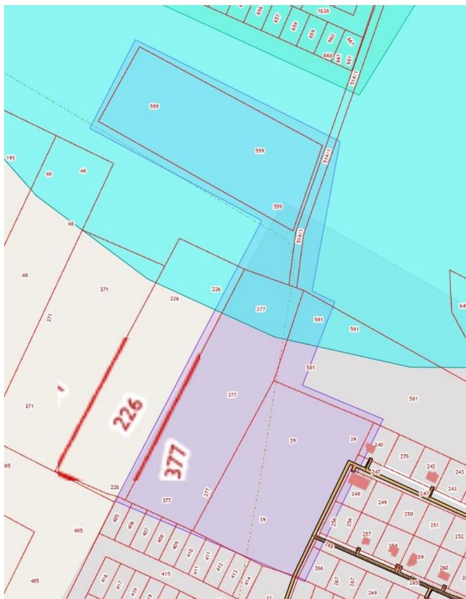
Схема границ территории, в отношении которой принято решение о подготовке документации по планировке территории