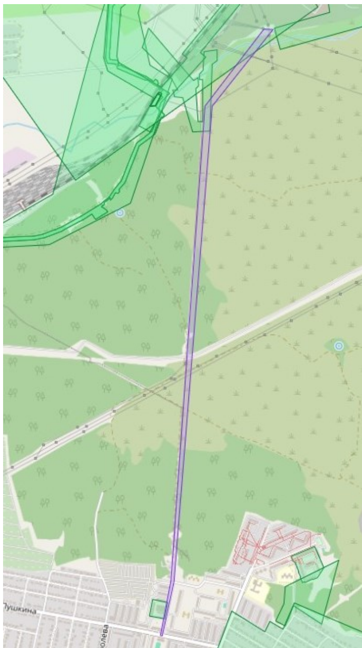
Схема границ территории, в отношении которой принято решение о подготовке документации по планировке территории