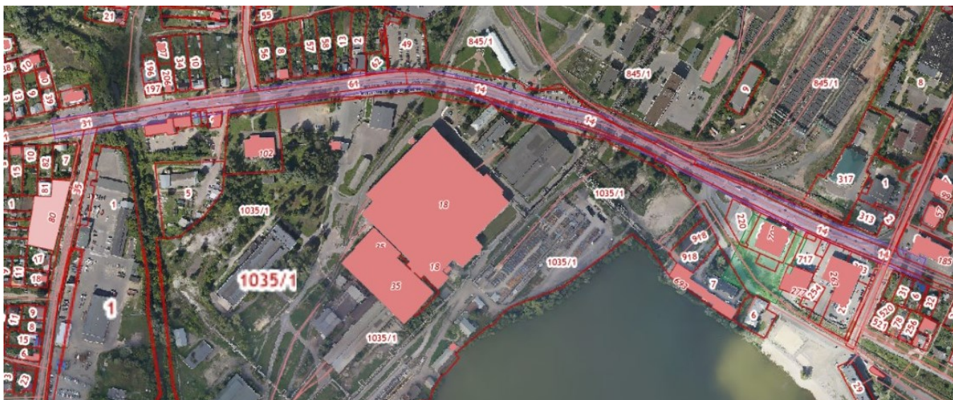
Схема границ территории, в отношении которой принято решение о подготовке документации по планировке территории