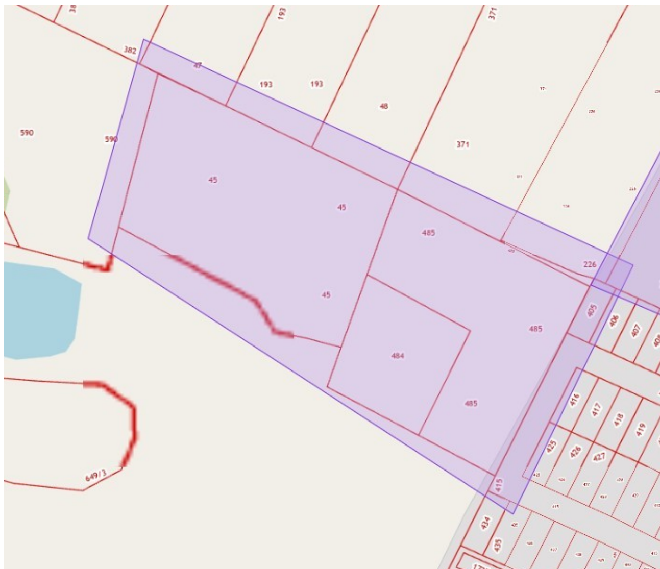
Схема границ территории, в отношении которой принято решение о подготовке документации по планировке территории