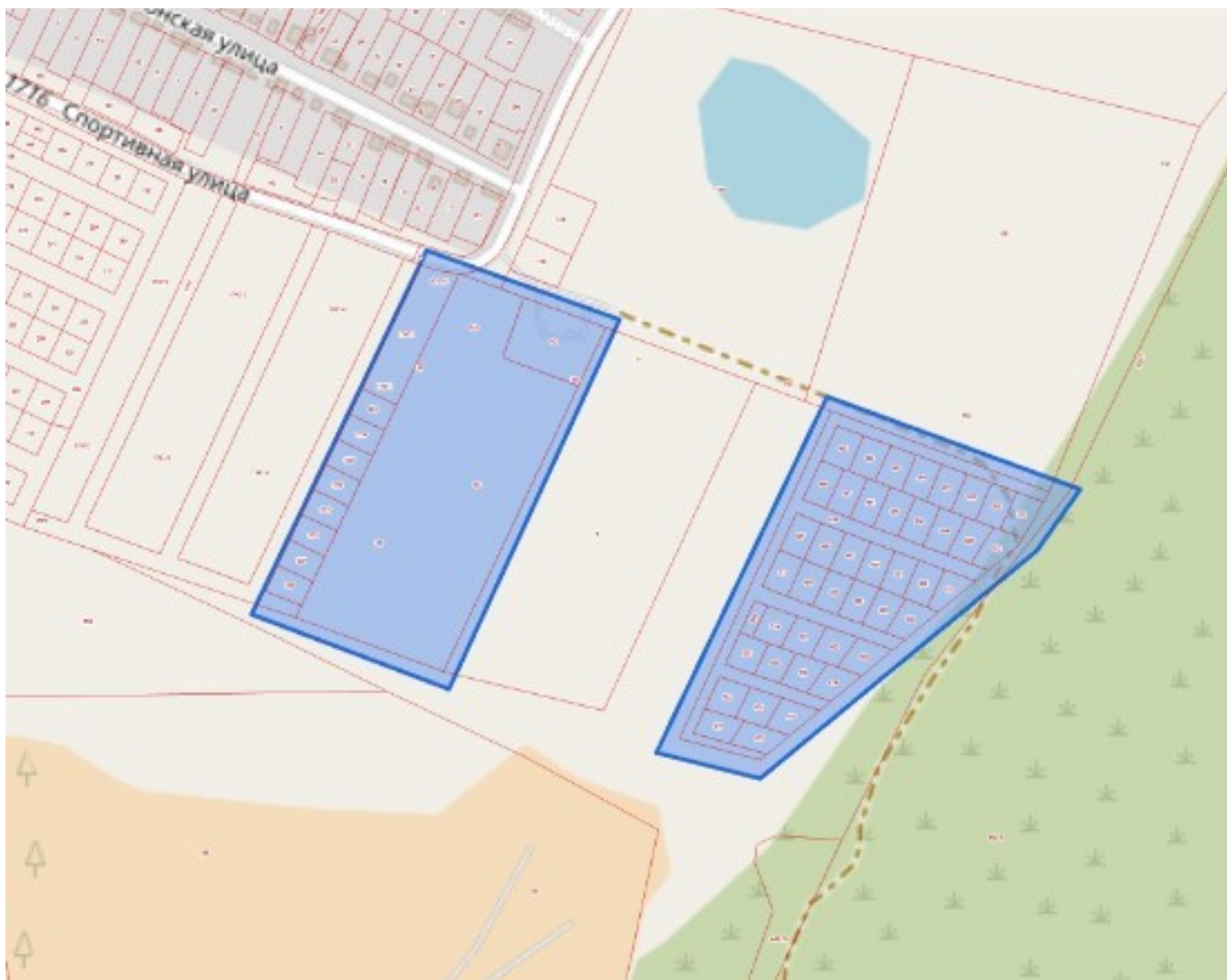
Схема границ территории, в отношении которой принято решение о подготовке документации по планировке территории