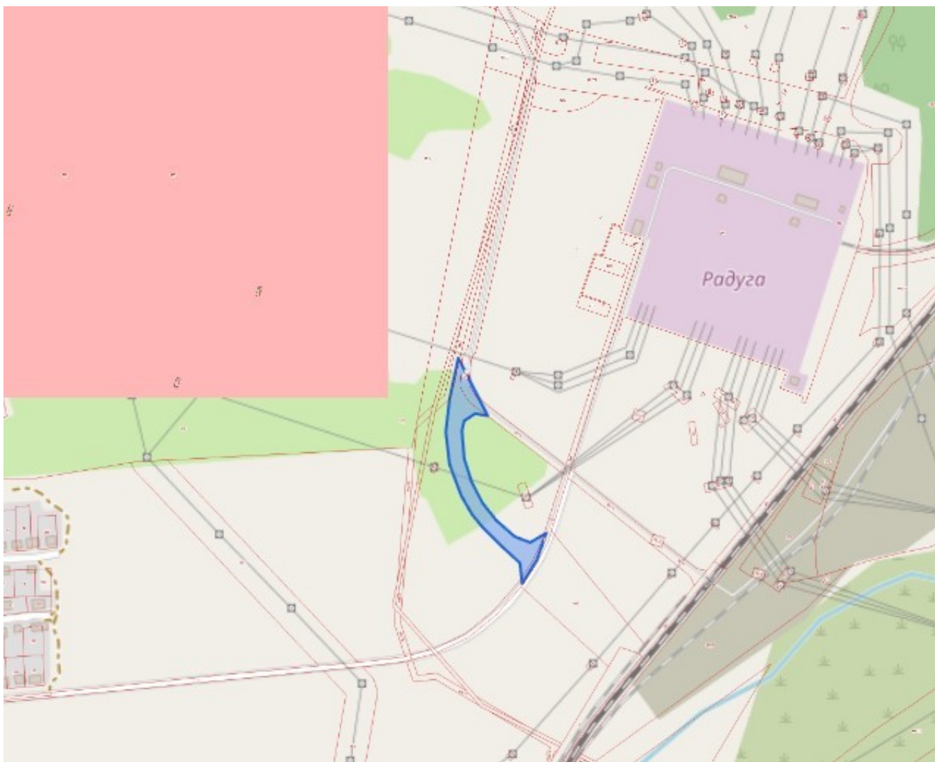
Схема границ территории, в отношении которой принято решение о подготовке документации по планировке территории