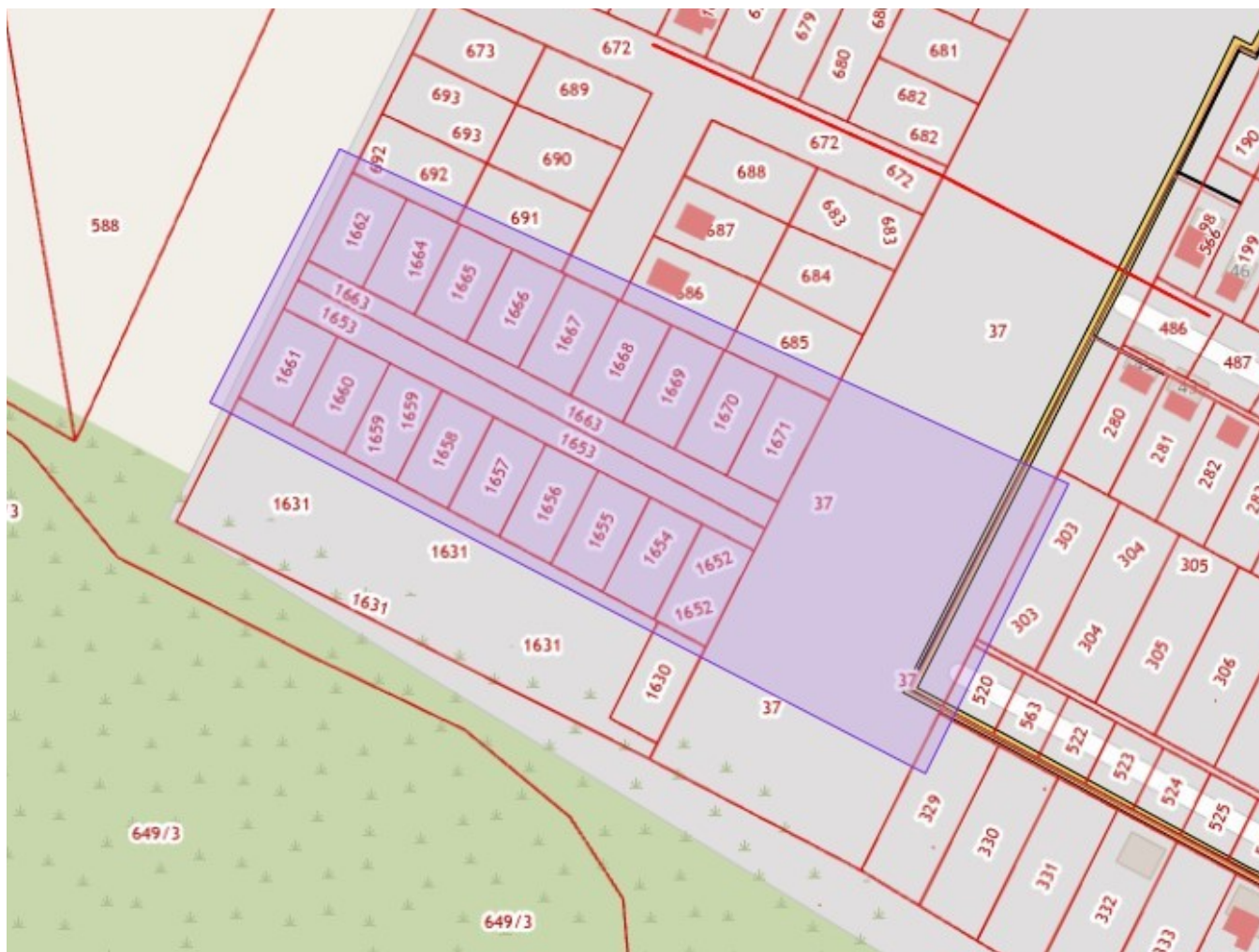
Схема границ территории, в отношении которой принято решение о подготовке документации по планировке территории