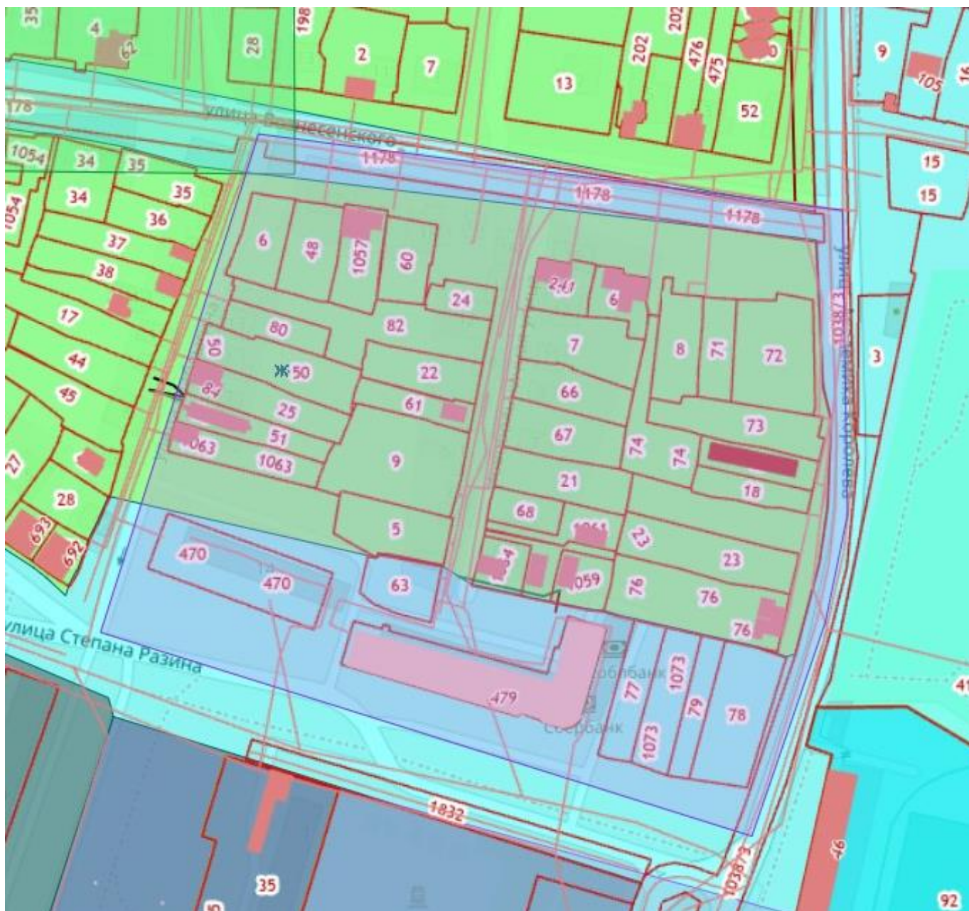
Схема границ территории, в отношении которой принято решение о подготовке документации по планировке территории