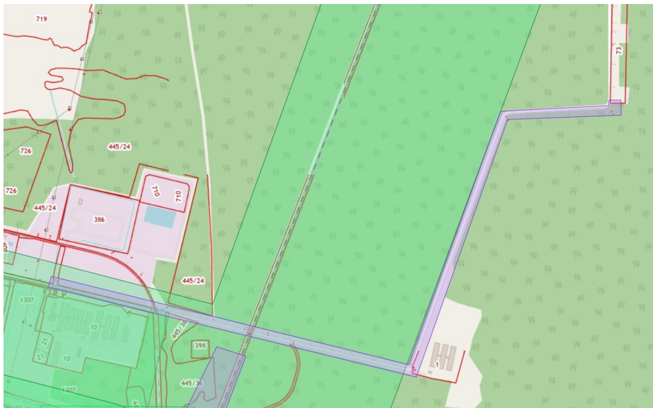
Схема границ территории, в отношении которой принято решение о подготовке документации по планировке территории