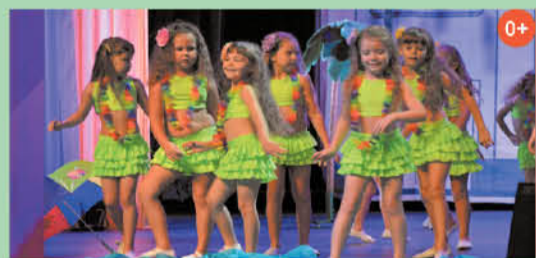
с участием вокальных и хореографических коллективов и солистов от 4 до 15 лет. Цена билета: 150 руб. Большой зал. Начало в 11.00

ДК им. И.И. Лепсе Гала-концерт VII конкурса детского творчества «Созвездие-2016»