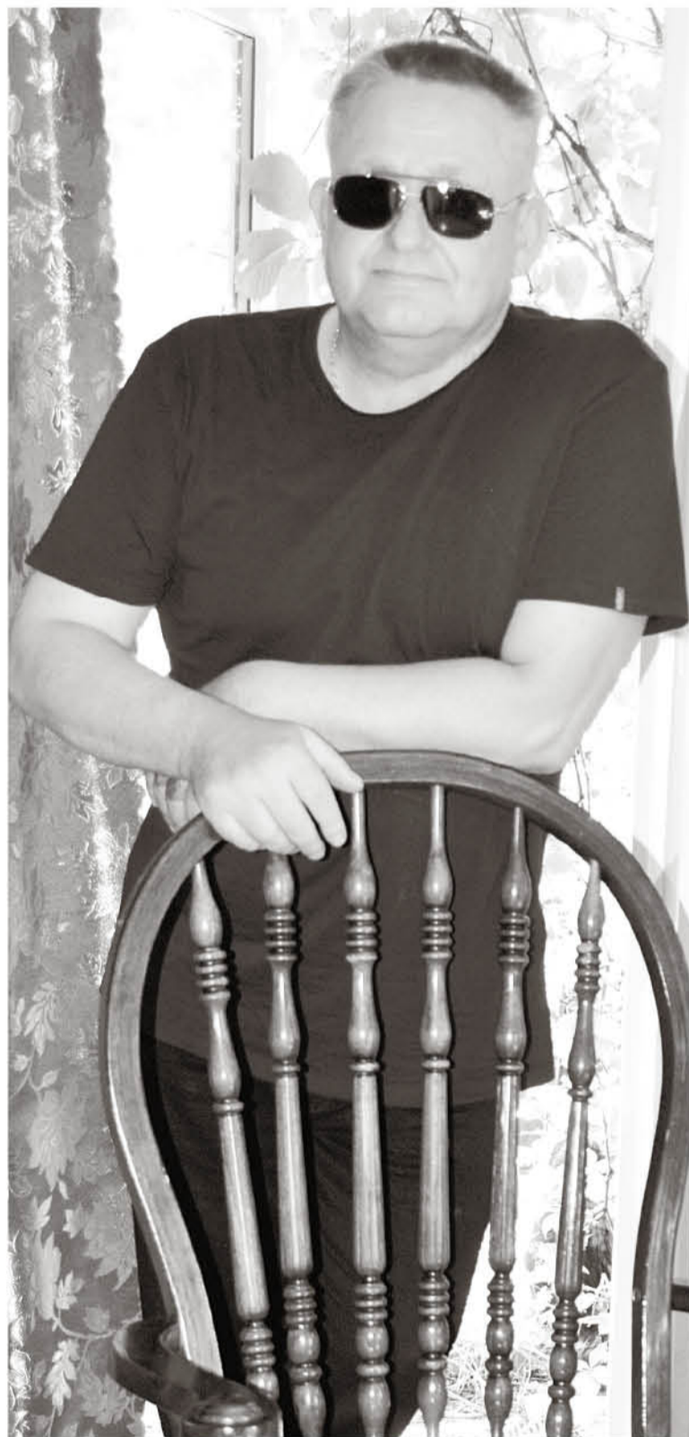
Счастье – это когда на тех, кто рядом, можно положиться

– Скорее да, чем нет. Смотря что понимать под развитием.