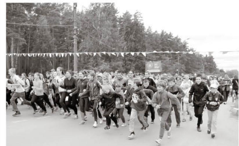
С 2015 года в Выксе проходит благотворительный забег «Кто бежит? Все бегут!». Его организуют БФ «ОМК-Участие», БМЗ и администрация округа

как много значит объединиться вокруг чужой беды, является благотворительный забег «Кто бежит? Все бегут!». Впервые он прошёл в 2015 году, тогда в нём приняли участие порядка тысячи уже второй год напоминающим,