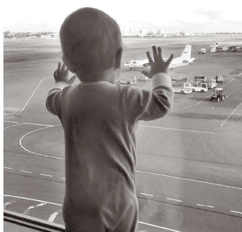
Песню «Жить», с которой начался проект «Жить.рф», Игорь Матвиенко написал под впечатлением от трагедии, произошедшей 31 октября 2015 года над Синайским полуостровом

В некоторых случаях мы можем помочь не только словами поддержки, но и вполне материально. Например, в Выксе проектом уже второй год напоминающим,