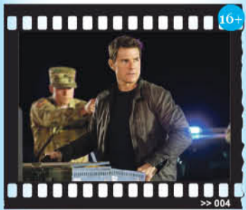
«Джек Ричер-2: Никогда не возвращайся»