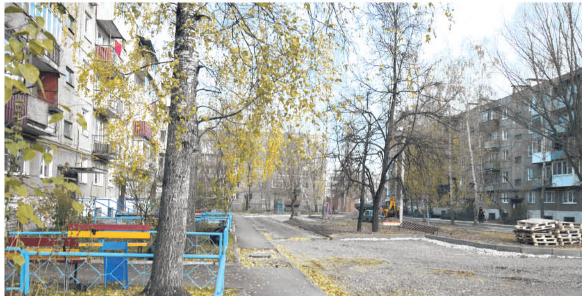
● Скоро двор домов №№30 и 32 будет благоустроен