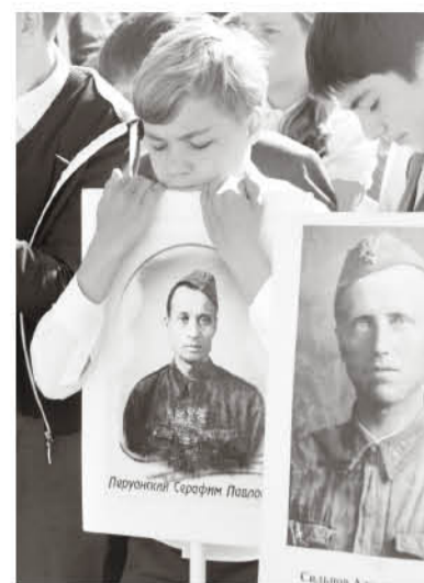
«Бессмертный полк» объединяет и разные возрастные группы