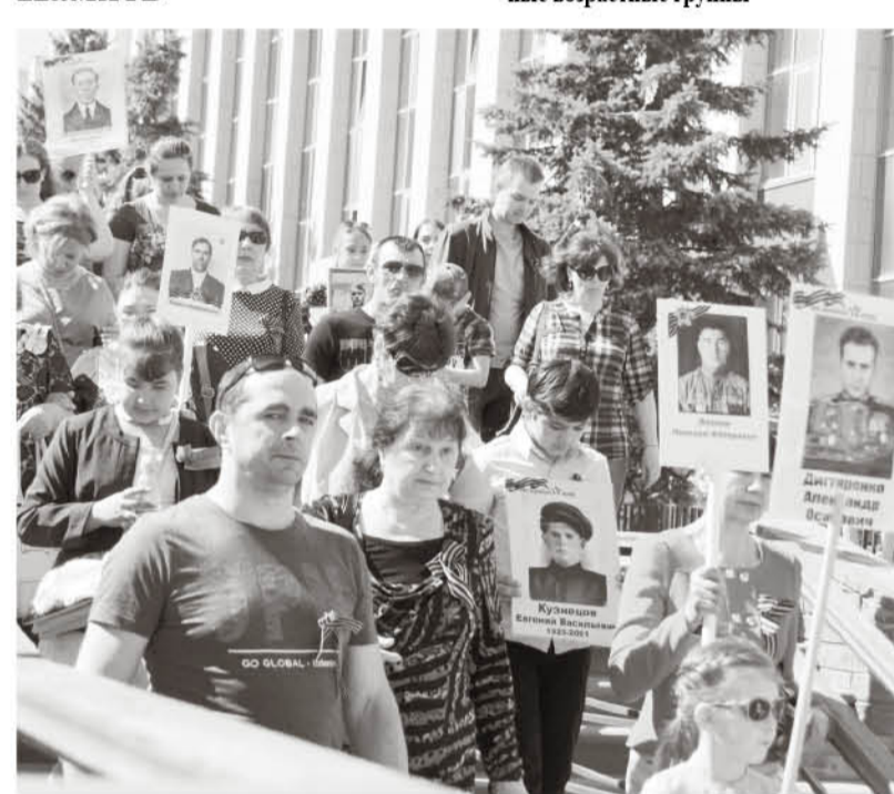
В Выксе «Бессмертный полк» стартует от здания администрации

Но объединяют нас не только «беды». Наше единство и в общей памяти, желании сохранить правдивую историю для потомков. Очень показательным здесь то, что большое количество людей собирается ежегодно, чтобы пронести по улицам и площадкам своего города портреты воинов-освободителей. Самой известной акцией, сплотившей миллионы россиян, живущих в нашей стране и за её пределами, стал «Бессмертный полк».