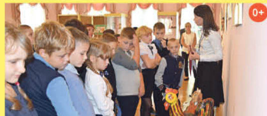
«Сказочный мир» С.Д. Брижан Главный выставочный зал. До 20 ноября