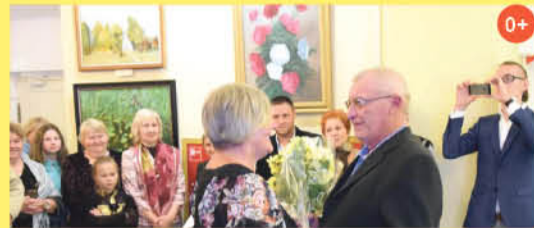
Выставка работ семьи Ярмощук «Ярмощук +К» Выставочная галерея западного флигеля