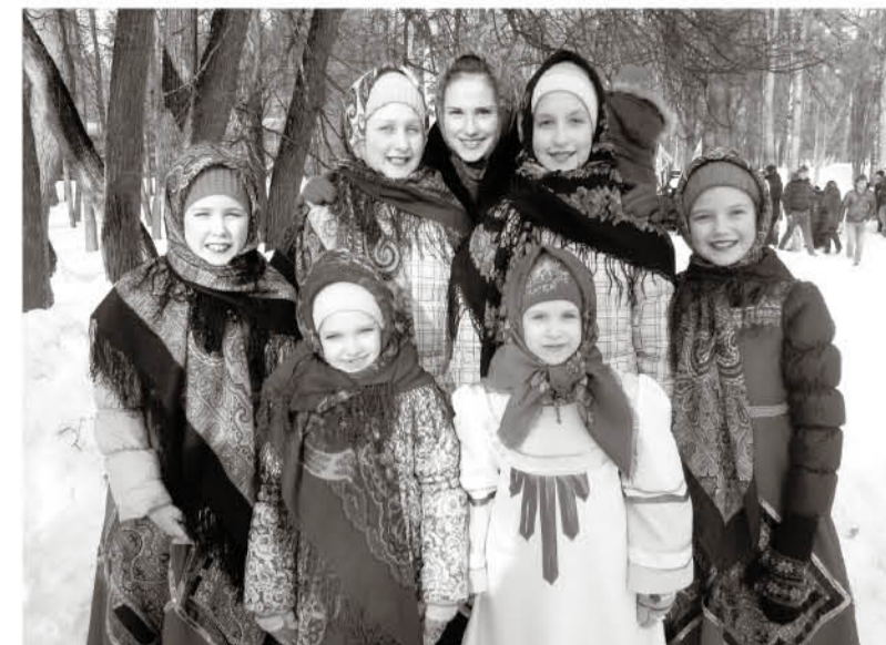
• Юные «Верёшк» на празднике Масленицы