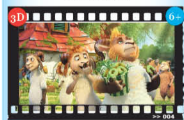
«Волки и овцы: бе-е-езумное превращение»