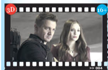
«Первый мститель: противостояние»