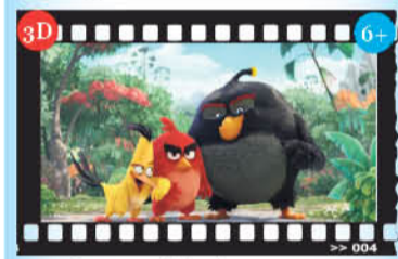
«Angry birds в кино»