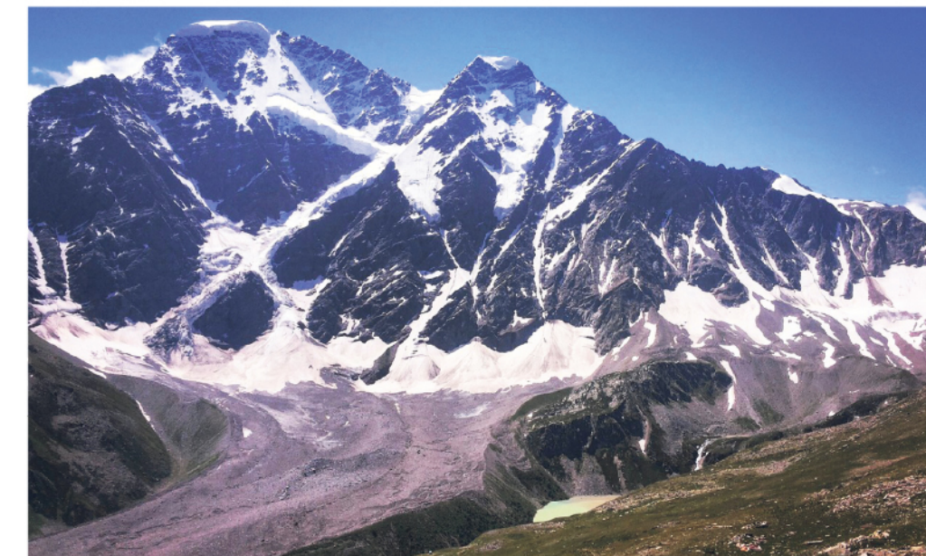
● Вид с Чегета на знаменитый ледник «Семёрка»