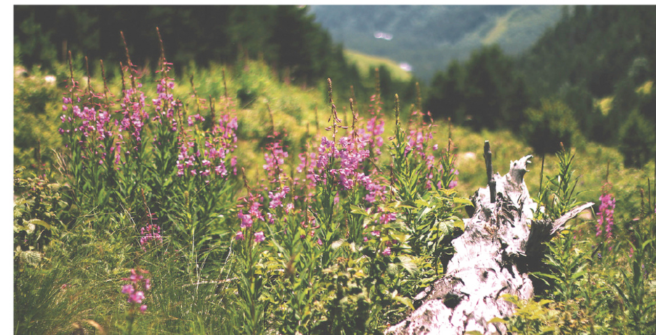
● Природа настолько разнообразна, что на склонах гор можно встретить альпийские луга, поражающие своим разнообразием

используем ли мы его рационально для того, чего хотим достичь? Всё ли задуманное успеет претвориться в жизнь?