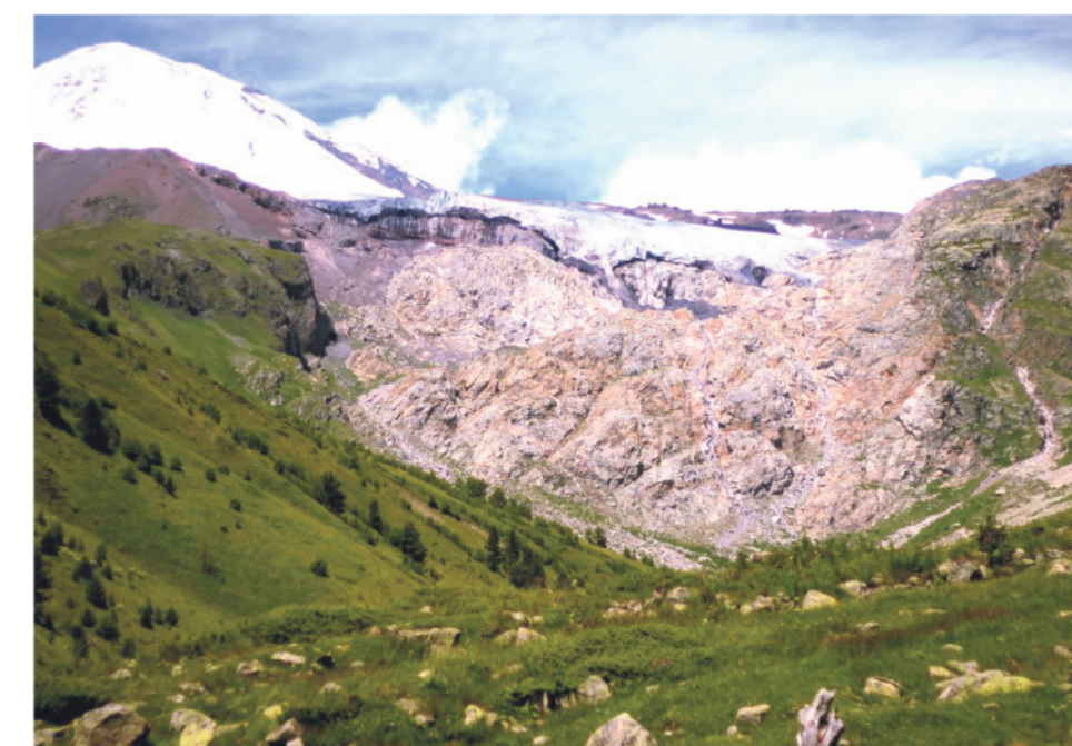
● Такую красоту стоит увидеть воочию хотя бы раз в жизни!