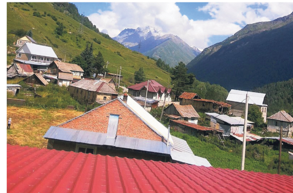
● Посёлок Байдаёво