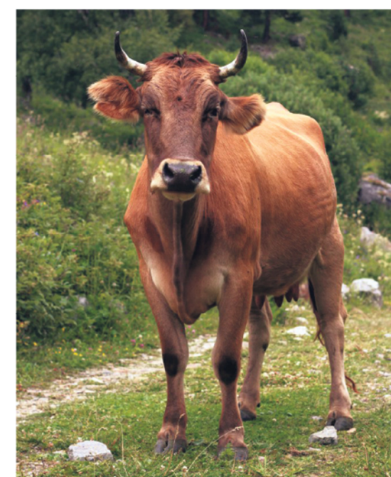
● Знаменитые коровы-скалолазки