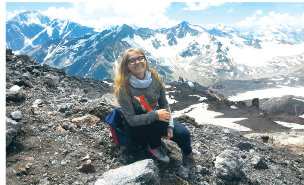
● Август начался с подъёма на Эльбрус. Ощущения непередаваемые

Как говорил знаменитый русский писатель Михаил Булгаков устами одного из своих персонажей, «случайные встречи – самые несчастливые на свете». В ущелье, на высоте 2300 м, встретила мудрую бабушку, заставившую задуматься о ценности всего, что нам дано сейчас, и, самое главное, о ценности своего времени. «У нас осталось только время», – произнесла она. И действительно,