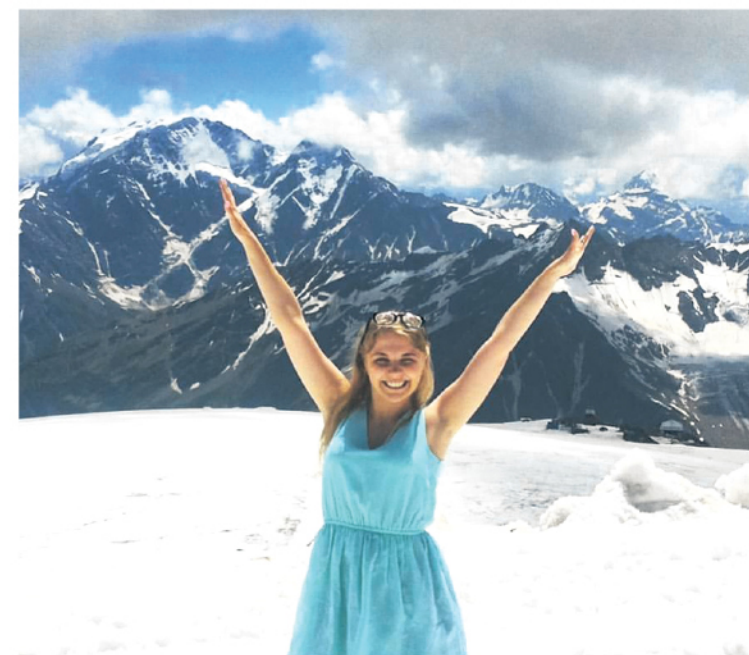
● На Эльбрусе. Высота 4200 метров. Принимаем солнечные ванны