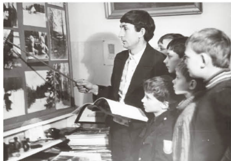
● В фотокружке, 1984 год