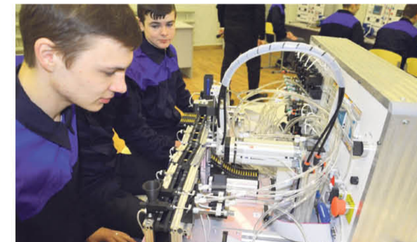
● Студенты II курса делают лабораторную работу