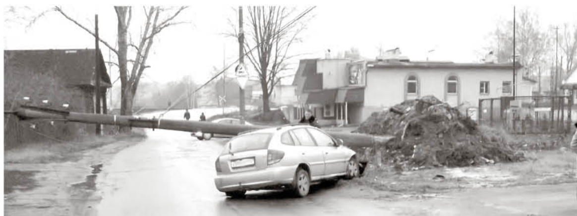
● Атаку автомобиля даже опора ЛЭП не выдержала

Особую тревогу вызывает рост, хотя он и небольшой, детского дорожно-транспортного травматизма. В этом году за девять месяцев юные жители округа стали участниками 16 ДТП, в которых, к счастью, погибших нет, но 16 детей получили травмы. В 2015 году за три квартала