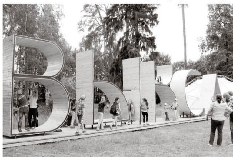
● Один из самых популярных у выксунцев арт-объектов будет интересен и гостям города